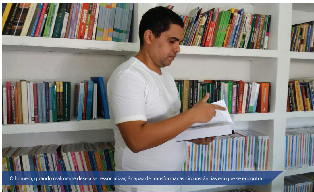
O homem, quando realmente deseja se ressocializar, é capaz de transformar as circunstâncias em que se encontra

Segundo Mahatma Gandhi, “A prisão não são as grades, e a liberdade não é a rua; existem homens presos na rua e livres na prisão. É uma questão de consciência.” O homem, quando realmente deseja se ressocializar, é capaz de transformar as circunstâncias em que se encontra. O projeto “Releitura – remição pela Leitura e Produção de Texto