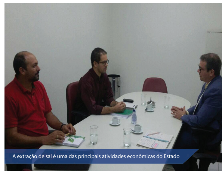
A extração de sal é uma das principais atividades econômicas do Estado

A extração de sal é uma das principais atividades econômicas do Estado. O Rio Grande do Norte é responsável por aproximadamente 97% da produção nacional.