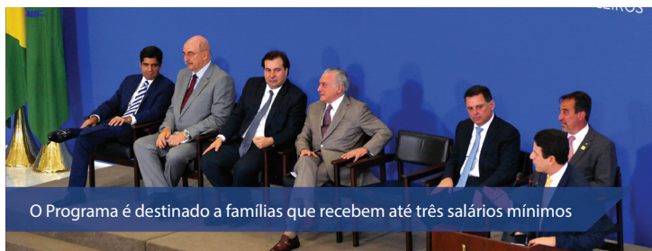
O Programa é destinado a famílias que recebem até três salários mínimos

Outra alteração feita pelos deputados é relacionada a habitações rurais. O texto aprovado diz que o programa deverá destinar, no mí-