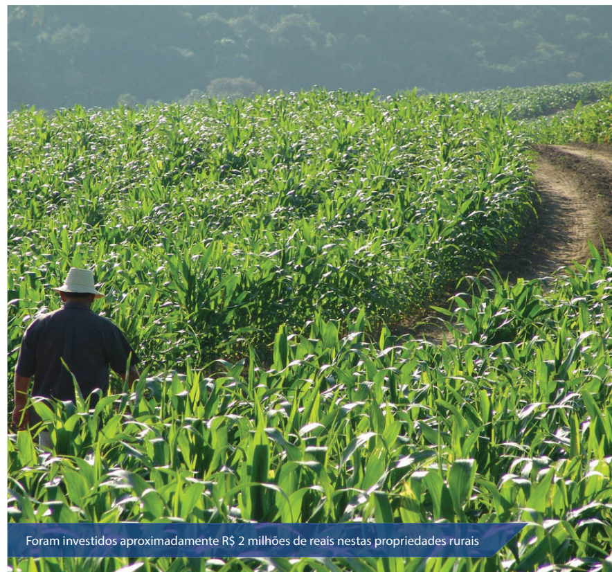
Foram investidos aproximadamente R$ 2 milhões de reais nestas propriedades rurais

Para a compra destas propriedades rurais e para realizar investimento nelas, foram investidos aproximadamente R$ 2 milhões de reais, provenientes do PNCF. Deste recurso, cerca de 700 mil reais, não reembolsáveis, serão investidos em projetos produtivos e de infraestrutura, que irão garantir trabalho e renda para essas famílias de trabalhadores rurais.